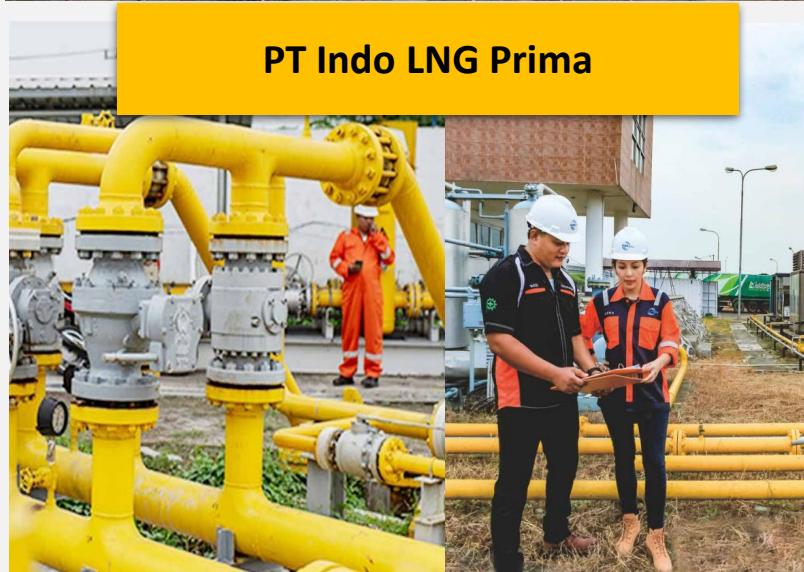
PT Indo LNG Prima