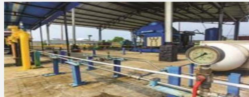
Mother Station Wunut

PT Indogas Kriya Dwiguna adalah anak usaha Perseroan adalah perusahaan swasta nasional yang berbisnis di bidang perdagangan gas alam atau gas bumi yang dikirim dalam berbagai moda transportasi, antara lain dalam bentuk CNG (Compressed Natural Gas) atau pipeline.