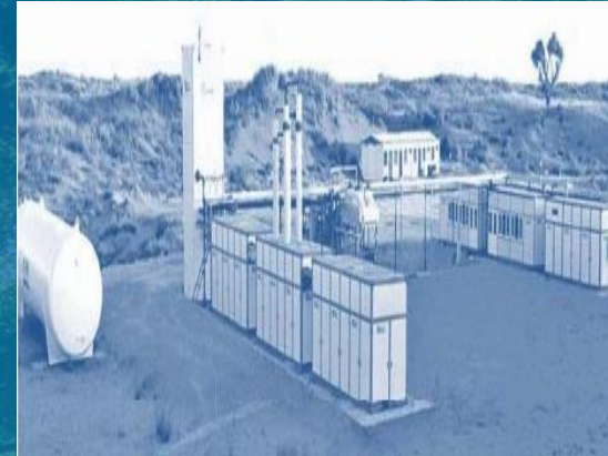
PT Indo LNG Prima