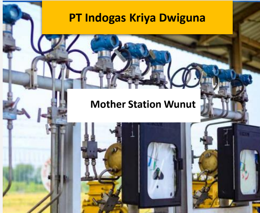
Mother Station Wunut