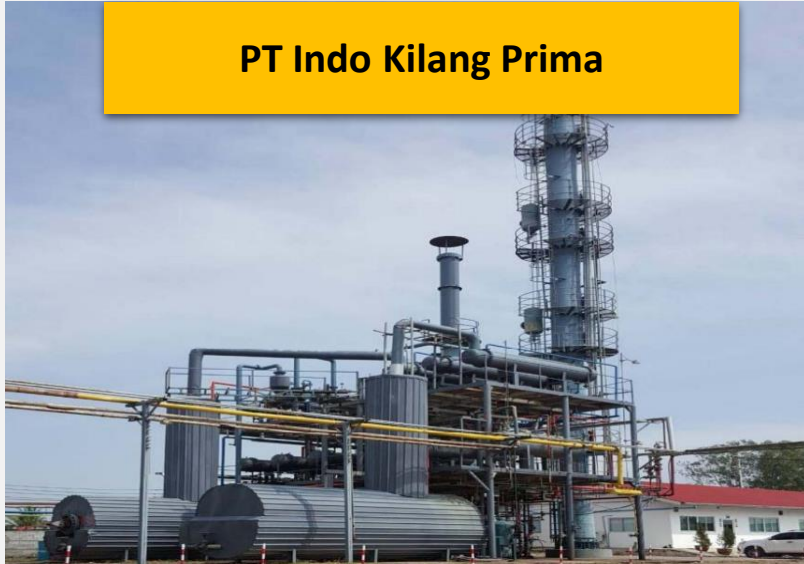
PT Indo Kilang Prima