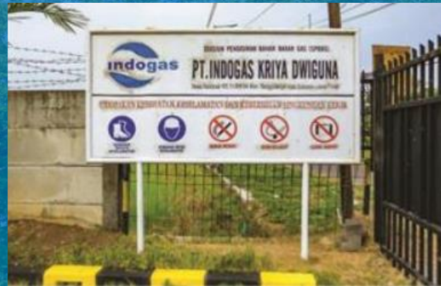
PT Indogas Kriya Dwiguna