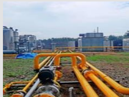
Mother Station Wunut