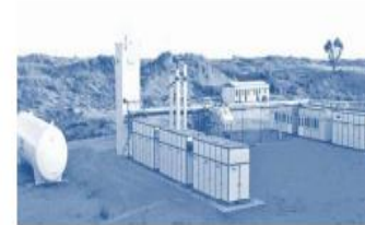
Nano LNG Facility