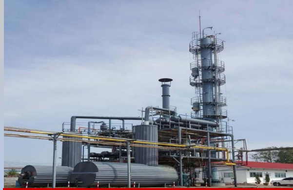
PT Indo Kilang Prima