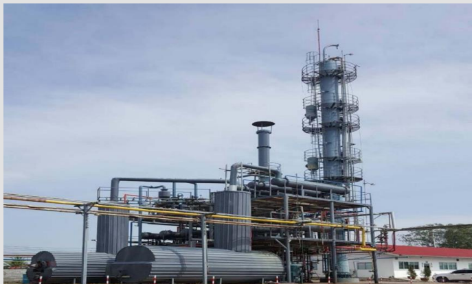
PT Indo Kilang Prima