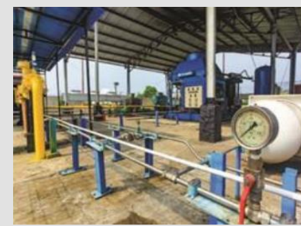
Mother Station Kalidawir