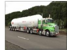
LNG Tranpostation Vehicle