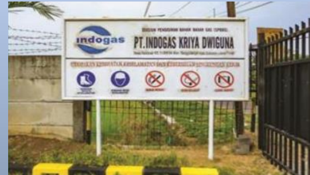
Mother Station Kalidawir