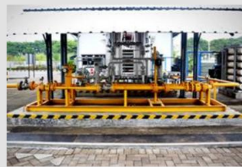
Gas Metering Sidoarjo