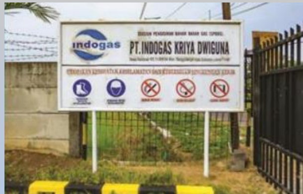
PT Indogas Kriya Dwiguna