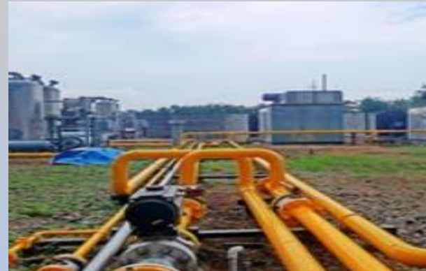
Mother Station Wunut

yang merupakan anak usaha Perseroan adalah perusahaan swasta nasional yang berbisnis di bidang perdagangan gas alam atau gas bumi yang dikirim dalam berbagai moda transportasi, antara lain dalam bentuk CNG (Compressed Natural Gas) atau pipeline