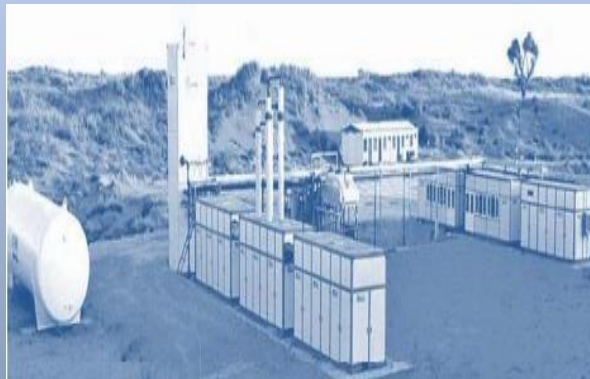
PT Indo LNG Prima